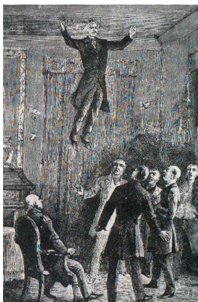
Daniel Dunglas Home

É o fato de pessoas ou coisas serem erguidas ao ar, sem auxílio exterior de caráter material, contrariando assim, aparentemente, as leis da gravidade.