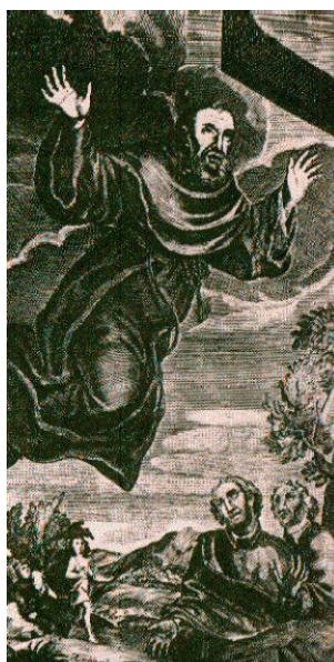
São José Cupertino