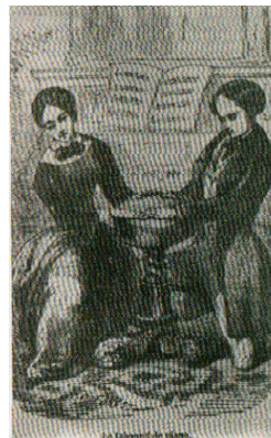
Experiência com o mocho

O grau de sensibilidade da mesa girante é proporcional ao potencial de força nervosa e de magnetismo conjugados, retirados dos presentes, o que lhe facilita libertar-se da força gravitacional do mundo físico, de conformidade com o volume e a natureza do ectoplasma que for extraído do ambiente.