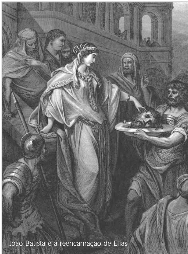
Jão Batista é a reencarnação de Elias