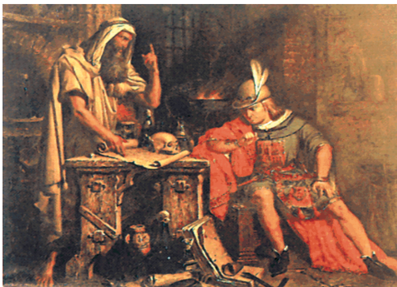
Soldado romano consultando um oráculo