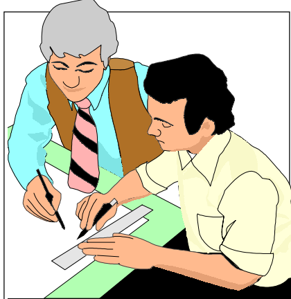
Vamos estudar juntos no Entrade

sistência social regular, estudos metódicos da Doutrina Espírita, atividades mediúnicas e atendimento público com tra-